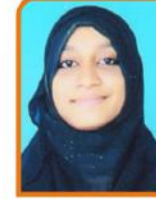
મસીહા અનુલ તરાજીયા ગામ:- વાંકાનેર ૭૨.૦૦ % (કોમર્સ)