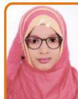
ફાએજા શબ્નીર ભૈડુ ગામ:- કોસાડી ૬૧.૧૪ % (સાયન્સ)