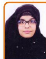
ફાએજા ઇશ્માઇલ જુભાઇ ગામ:- કોસાડી ૬૯.૨૮ % (સાયન્સ)