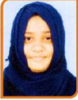
સાયમા સમદ સીદાત ગામ:- કોસંબા ૮૩.૫૩ % (સાયન્સ)