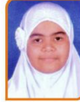
સના મો.મુબેર અલ્લુ ગામ:- રાંદેર ૭૩.૭૩ % (કોમર્સ)